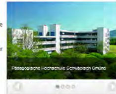
Pädagogische Hochschule Schwabisch Gmünd

Technik & Wirtschaft: Integrierte Didaktik